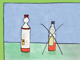
Nur Originalgebinde verwenden !