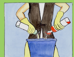
Produkte nicht vermischen !