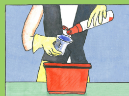
Richtig dosieren !